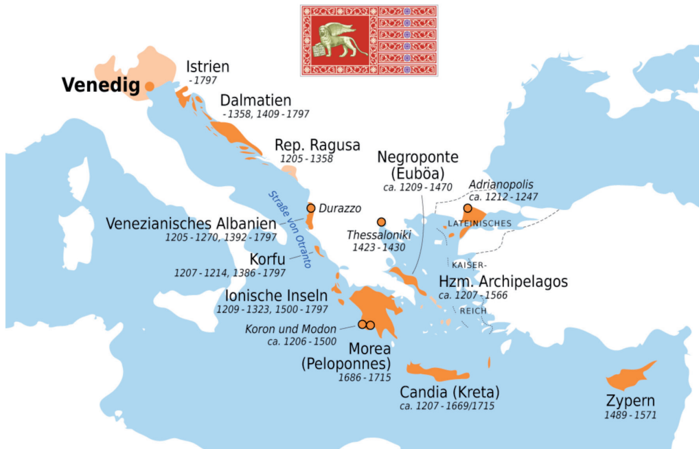
Abbildung 2: Venezianische Kolonien 13. bis 18. Jahrhundert 113