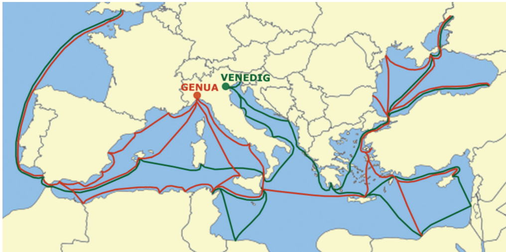
Abbildung 1: Handelsstraßen Venedigs und Genuas im 13. und 14. Jahrhundert. 112